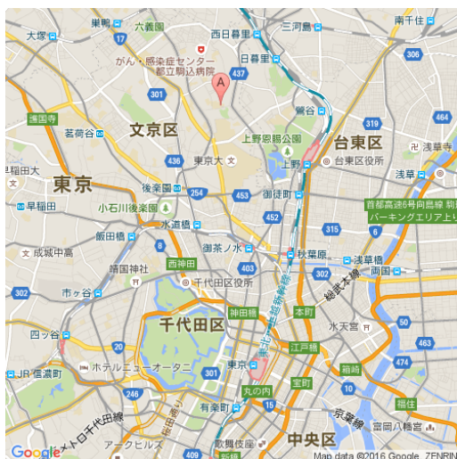
日本医科大学眼科関連施設の分布図